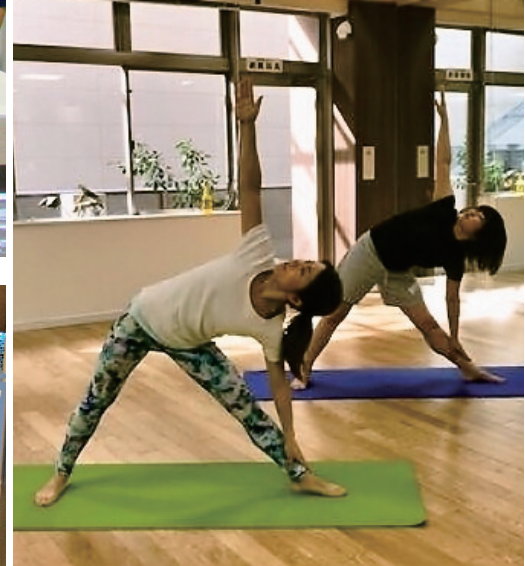
呼吸法を行いながら全身をダイナミックに動かすポーズをご紹介します