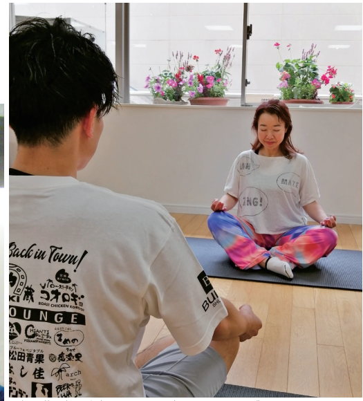
瞑想は世界中のビジネスパーソンが取り入れていてブームになっています