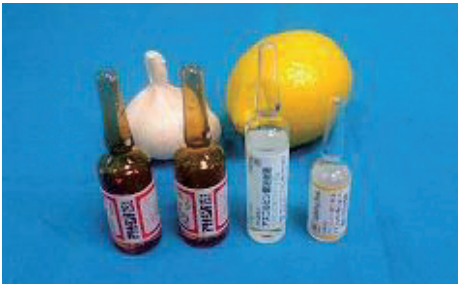
コロナ予防のおすすめは[ビタミンC]を多く含むビタミン注射です