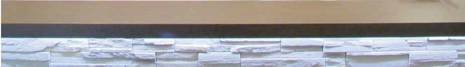
感染症予防策として入口でのアルコール消毒、ドア・ベッド等の物品の定期除菌・換気、スタッフの体調管理・手指消毒を徹底しています