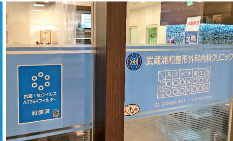
安心安全の高性能空気清浄フィルターを装着しています。