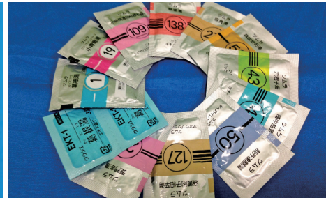
免疫力を高めるビタミン注射は効果別に複数ご用意しております。抗ウイルス・免疫力を上げる効果がある漢方薬が多数あります。