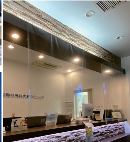
受付には新型コロナウイルス感染予防対策シールドを設置しております。