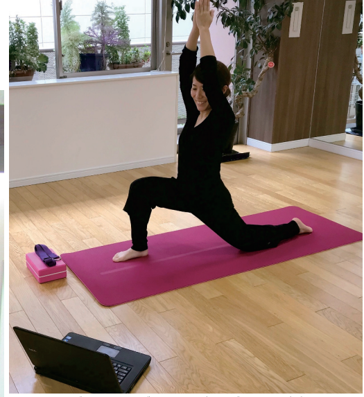
オンラインヨガはスマホ・タブレット・PCがあればレッスンが受けられます