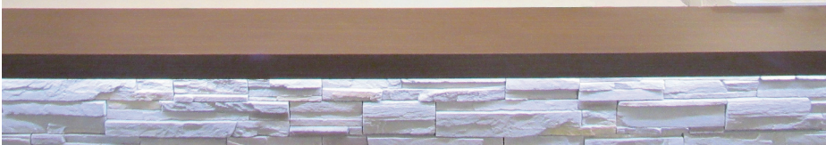
地域の皆様が健やかで痛みのない「スマートライフ」が過ごせる様に、スタッフ一同全力でサポートをさせていただきます。