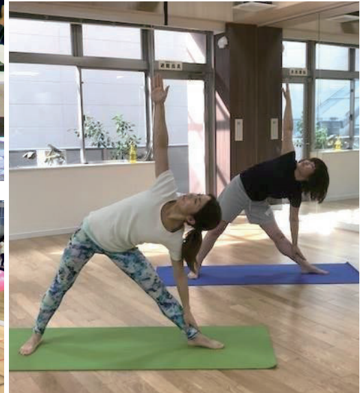
秋～冬に向けて季節の変わり目に対応できる免疫力向上のポーズをご紹介します