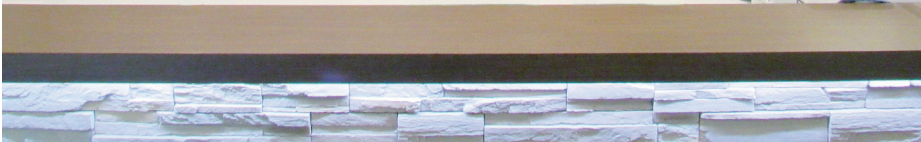
新型コロナウイルス感染症対策として業務エアコン用ウイルスフィルター・抗ウイルス効果のあるチタンコート剤を壁にコーティング予定です。