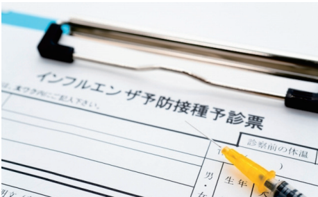
ワクチン接種を早めに行い、流行時期に備えましょう。