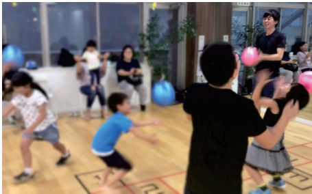
「キッズ」楽しみながら運動を行い、能力を高めていきます。