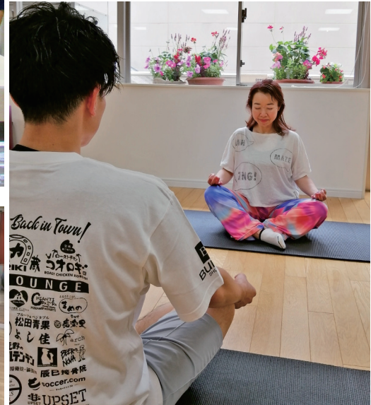
瞑想は決して難しくありません、日々の生活に取り入れてみませんか。