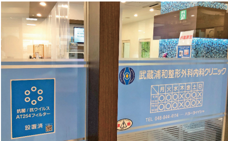
安心安全の高性能空気清浄フィルターを装着しています。