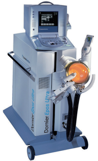
埼玉県でも数少ない「体外衝撃波疼痛治療装置」を導入しております。