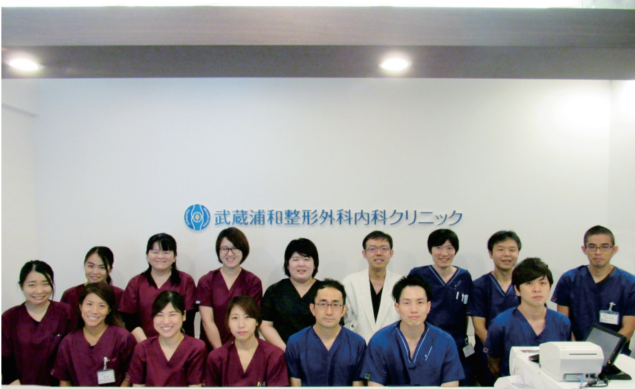
武蔵浦和整形外科内科クリニック