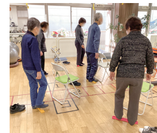
[左上] ヒアルロン酸が効かなくなった関節症の膝痛に再生医療PRP [左下] 充実の設備を誇るリハビリテーション室 [右上] 疲労や美容、アンチエイジングに、ビタミン注射を [右下] シニア向け体操教室で脳トレと筋トレを。