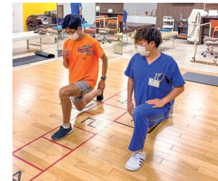
[左上]ヒアルロン酸が効かなくなった変形性関節症の膝痛に再生医療PRPが有効 [左下]インド留学したセラピストが施術 [右上]ハイスペック1.5気圧モデル導入 [右下]多種多様な資格を保持したトレーナーが指導