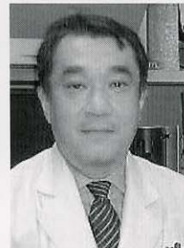
日本医科大学消化器内科 助教授、付属病院内視鏡 センター室長・医学博士

めざましく進歩する内視鏡の技術。なかでも、従来のおよそ2/3の細さの内視鏡を鼻から挿入し、胃や食道の検査をする「経鼻(けいび)内視鏡検査」が注目を集めています。がんは何より早期発見・早期治療が肝心。苦痛の少ない経鼻内視鏡検査を導入する病院やクリニックも増えています。