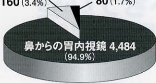
(出雲中央クリニック調べ)

□からの胃内視鏡 160 (3.4%) 鼻からの胃内視鏡 4,484 (94.9%)