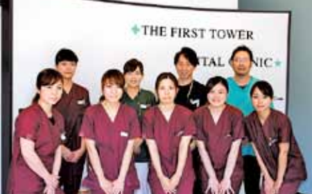
「通いやすい雰囲気づくりを心掛けています」とスタッフ

「足裏健康法」とも言われ、足の裏の反射区を適度に刺激することで体調を整えていく治療法です。器具などは使わず指の関節を使います。オイルやクリームを使って滑りを良くし、足裏からかかろはぎ、ひざ裏までを施術します。第二の心臓と言われる足をほぐすことで血行が促進され、新陳代謝が高まる