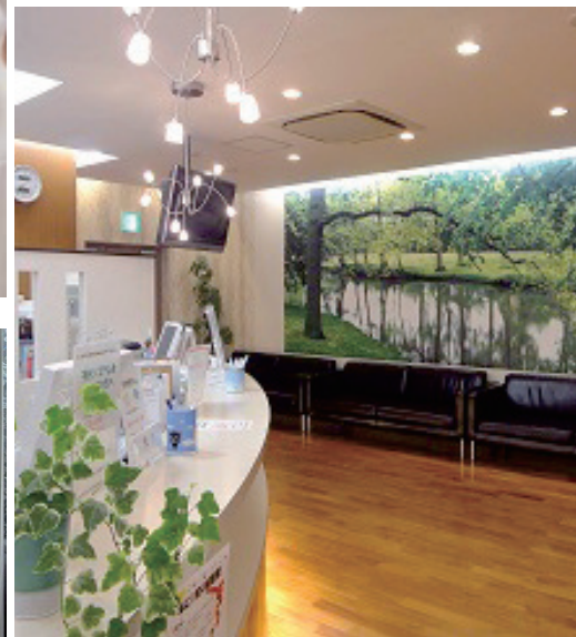
広々としたアロマ香る空間