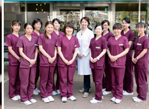
患者様一人一人の皮膚のお悩みを解決致します。悩まずにご相談下さい。