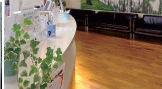
広々としたアロマ香る空間