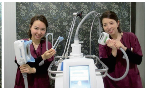
やせにくい部分の脂肪を凍らせて着実に減少させます。